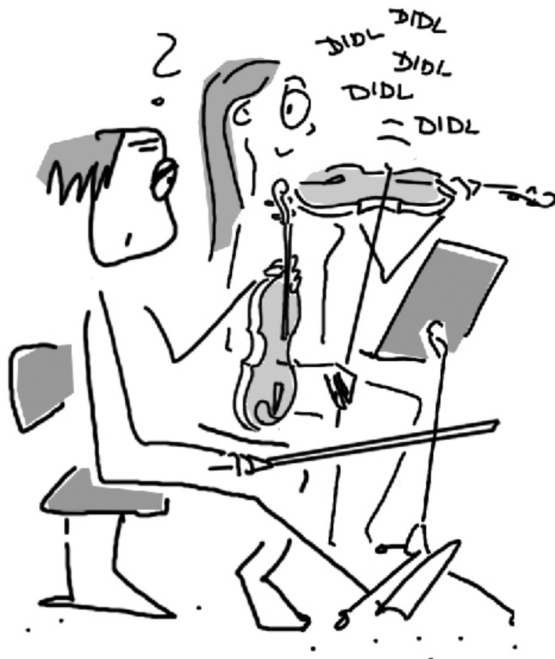
Orchesterregel Nr. 17

17. Wenn alle fertig sind, solltest du nicht unbedingt noch das Stückchen spielen, das du noch übrig hast.